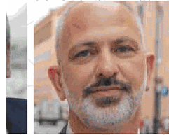
LUIGI NAVE M5S | COMMISSIONE AMBIENTE, TRANSIZIONE ECOLOGICA ED ENERGIA, SENATO