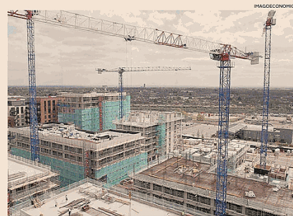
Costruzioni. Per il settore il 2025 si è chiuso con una piccola flessione

Nei 16 mila cantieri aperti del Pnrr lavorano 5.600 aziende, due terzi sono in fase di conclusione delle opere.